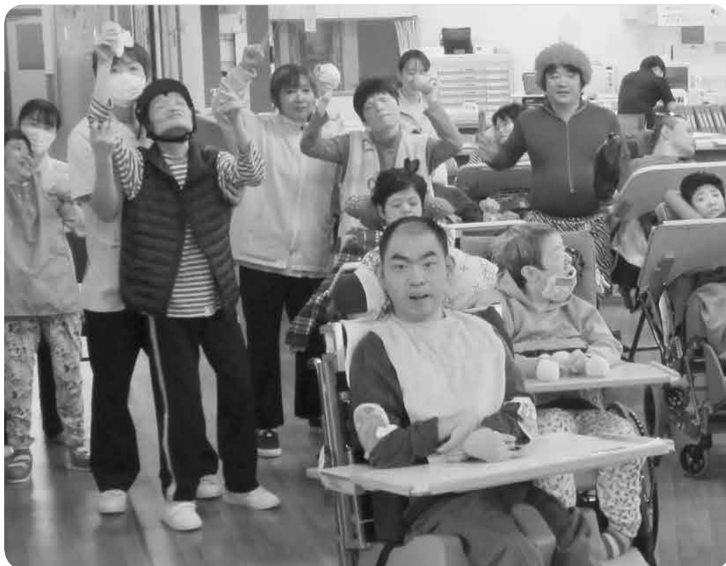
元気に過ごしています！（ひかり棟節分行事より）