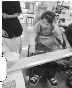
DIYで プランターづくり♪