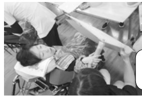
「おおきなかぶ」の お話を・・・