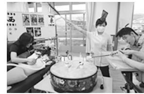
久山場所にて とんとん相撲