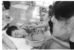
ランプシェードにはる 和紙の色付け